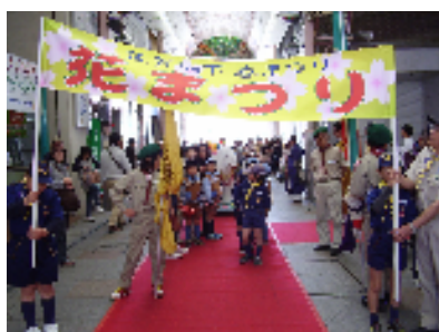
「花まつり」の横断幕を持つカブ隊員