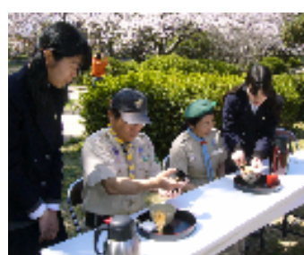
野下、新郷両隊長も野点でに挑戦