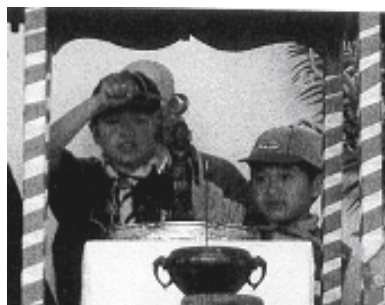
お釈迦さんに甘茶を掛けるスカウト