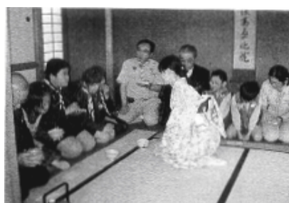
茶室「清恵庵」で抹茶を一服