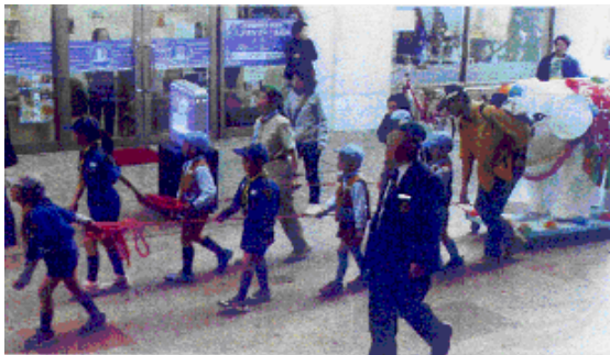
商店街を白ぞうを引いて行進