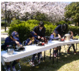
野点で茶を点てるカブ