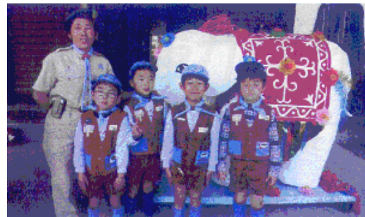
白象の前で「花まつり」に参加したビーバーたち