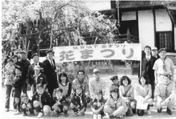
願正寺のしだれ桜満開の前で「花まつり」参加者全員で記念写真