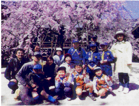
お茶会会場に出発前、願正寺でビーバー・カブ隊と保護者